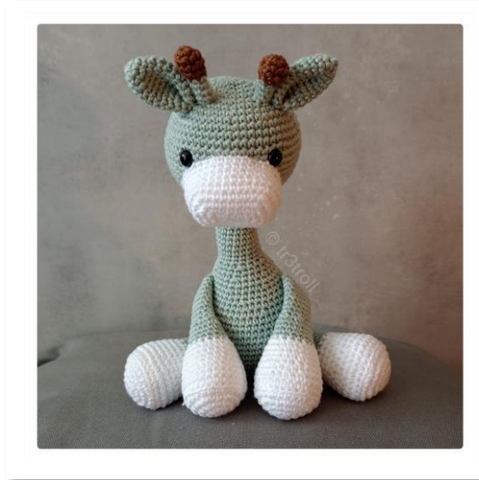
Helena Lifvenborg - Tr3troll ©2022